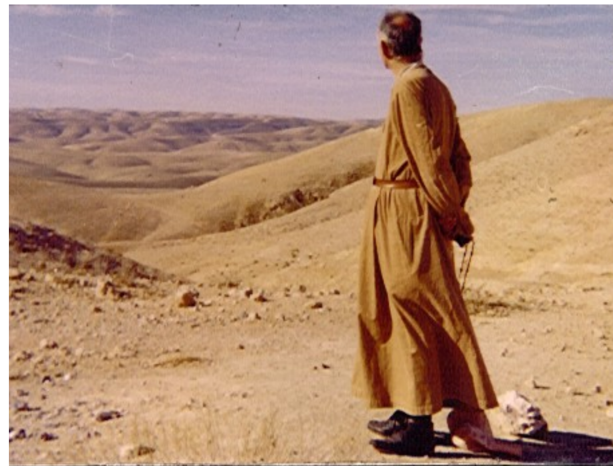
Le Famiglie della Visitazione