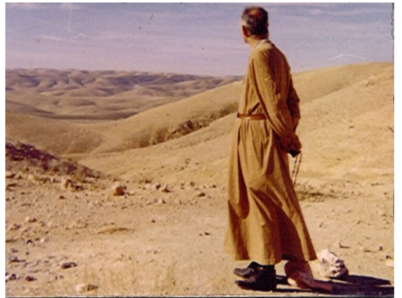
Le Famiglie della Visitazione