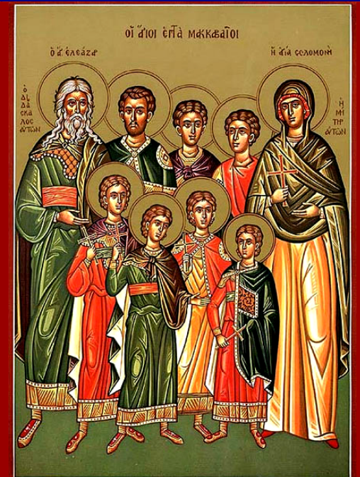
Eleàzaro con i santi Maccabei e la loro madre