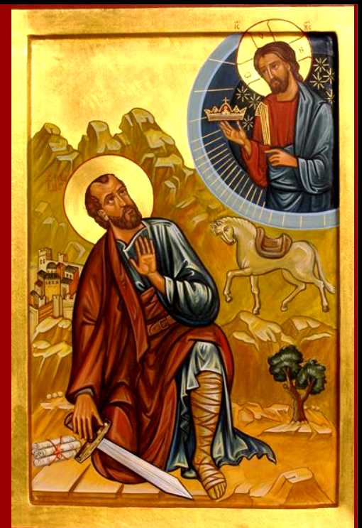
Conversione di S. Paolo