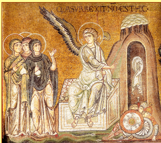
Le mirofore al sepolcro